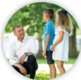
Thomas Stelzer Landeshauptmann

„Die beste Bildung braucht auch die besten Rahmenbedingungen. Wir wollen Oberösterreich zum Kinderland Nr. 1 machen.“